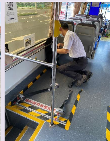
※110年7月28日本所稽查總達客運