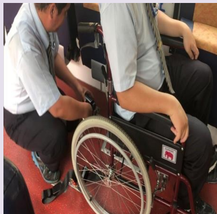
※110年5月10日本所稽查彰化客運