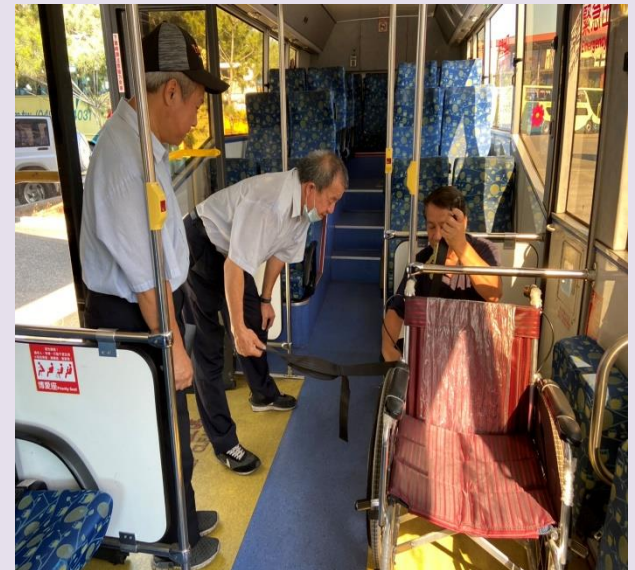
※110年5月12日本所稽查南投客運